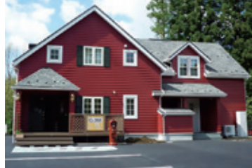
[建築条件付宅地]価格表 [16区画]